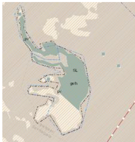
Ote vahvistetusta maakuntakaavasta Venäjänsaari