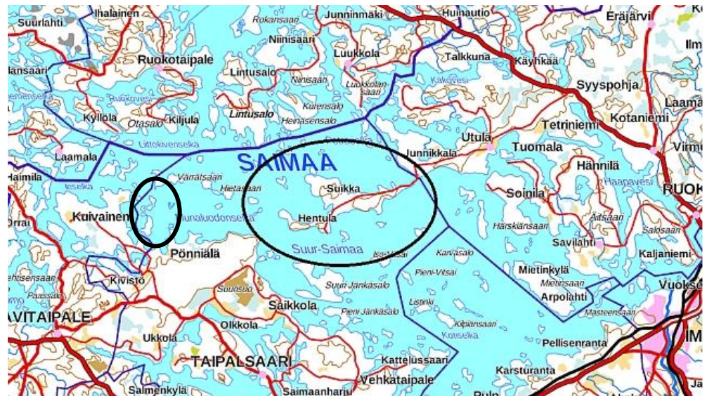
Suunnittelualueen seudullinen sijainti

Yleiskaavan muutoskohteet sijaitsevat Taipalsaaren kunnassa Suur-Saimaan alueella Kyläniemessä ja Venäjänsaarella.