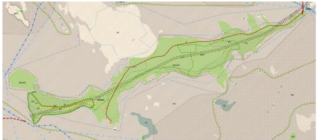
Ote vahvistetusta maakuntakaavasta Kyläniemi

Etelä-Karjalan maakuntavaltuusto hyväksyi Etelä-Karjalan 1. vaihemaakuntakaavan 24.2.2014. Vaihekaava kattaa koko maakunnan ja teemana on kaupallisten palveluiden, elinkeinoelämän ja liikenteen kehittämismahdollisuudet. Se korvasi 21.12.2011 vahvistetun Etelä-Karjalan maakuntakaavan vaihekaavan aluevarausten osalta