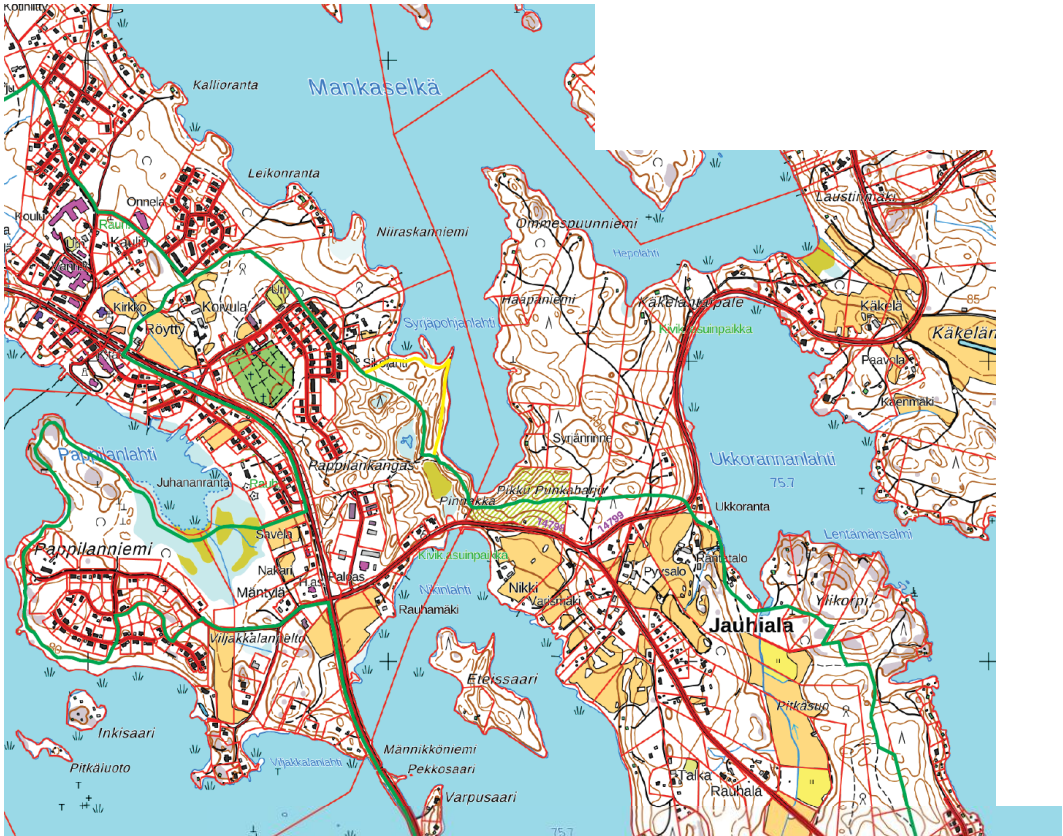
Karttapohja pohjoinen oikea

Vihreällä ehdotettu reitti ja keltaisella vaihtoehdotiset linjaukset.