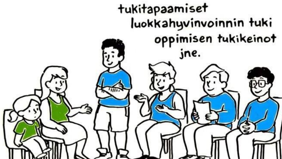
Kuvakaappaus Etelä-Karjalan hyvinvointialueen opiskeluhoitoa esittelevältä videolta