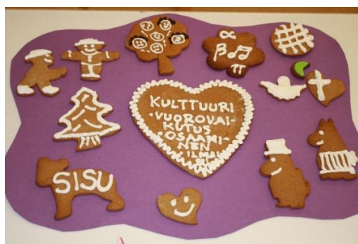
KUVA 5. Kulttuurinen osaaminen ja vuorovaikutus

Kouluyhteisössä oppilaat saavat kokemuksia vuorovaikutuksen merkityksestä myös omalle kehitykselle. He kehittävät sosiaalisia taitojaan, oppivat ilmaisemaan itseään eri tavoin ja esiintymään eri tilanteissa. Opetuksessa tuetaan oppilaiden kasvua monipuoliseksi ja taitaviksi kielenkäyttäjiksi sekä äidinkielellään että muilla kielillä. Oppilaita rohkaistaan vuorovaikutukseen ja itsensä ilmaisemiseen vähäiselläkin kielitaidolla. Yhtä tärkeätä on oppia käyttämään matemaattisia symboleita, kuvia ja muuta visuaalista ilmaisua, draamaa sekä musiikkia ja liikettä vuorovaikutuksen ja ilmaisun välineinä. Koulutyöhön sisältyy myös monipuolisia mahdollisuuksia käsillä tekemiseen. Oppilaita ohjataan arvostamaan ja hallitsemaan omaa kehoaan ja käyttämään sitä tunteiden ja näkemysten, ajatusten ja ideoiden ilmaisemiseen. Koulutyössä rohkaistaan mielikuvituksen käyttöön ja kekseliäisyyteen. Oppilaita ohjataan edistämään toiminnallaan esteettisyyttä ja nauttimaan sen eri ilmenemismuodoista.