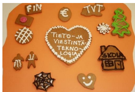
KUVA 8. Tieto- ja viestintäteknologia

Oppilaita opastetaan tuntemaan tvt:n erilaisia sovelluksia ja käyttötarkoituksia sekä huomaamaan niiden merkitys arjessa, ja ihmisten välisessä vuorovaikutuksessa ja vaikuttamisen keinona. Yhdessä pohditaan, miksi tieto- ja viestintäteknologiaa tarvitaan opiskelussa, työssä ja yhteiskunnassa ja miten näistä taidoista on tullut osa yleisiä työelämätaitoja. Tieto- ja viestintäteknologian vaikutusta opitaan arvioimaan kestävän kehityksen näkökulmasta ja toimimaan vastuullisina kuluttajina. Oppilaat saavat perusopetuksen aikana kokemuksia tvt:n käytöstä myös kansainvälisessä vuorovaikutuksessa. He oppivat hahmottamaan sen merkitystä, mahdollisuuksia ja riskejä globaalissa maailmassa.