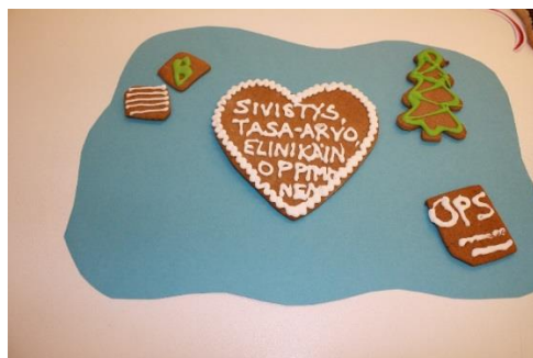
KUVA 3. Sivistys, tasa-arvo ja elinikäinen oppiminen

Valtioneuvoston asetuksessa säädettyt tavoitteet ohjaavat tarkastelemaan opetusta kokonaisuutena, joka rakentaa tässä ajassa tarvittavaa yleissivistystä ja luo pohjaa elinikäiselle oppimiselle. Tiedonalakohtaisen osaamisen lisäksi tulee tavoitella oppiainerajat ylittävää osaamista. Tähän pohjautuen opetussuunnitelman perusteissa määritellään tavoitteet ja sisällöt sekä yhteisille oppiaineille että tavoitteet oppiaineita yhdistäville laaja-alaisille osaamisalueille ja monialaisille oppimiskokonaisuuksille. Tavoitteiden toteutuminen edellyttää suunnitelmallista yhteistyötä ja tavoitteiden toteutumisen arviointia.