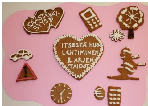
KUVA 6. Itsestä huolehtiminen ja arjen taidot

Oppilaita opastetaan kehittämään kuluttajataitojaan sekä edellytyksiään omasta taloudesta huolehtimiseen ja talouden suunnitteluun. Oppilaat saavat ohjausta kuluttajana toimimiseen, mainonnan kriittiseen tarkasteluun sekä omien oikeuksien ja vastuiden tuntemiseen ja eettiseen käyttöön. Heitä kannustetaan kohtuullisuuteen, jakamiseen ja säästäväisyyteen. Perusopetuksen aikana oppilaat harjaantuvat kestävä elämäntavan mukaisiin valintoihin ja toimintatapoihin.