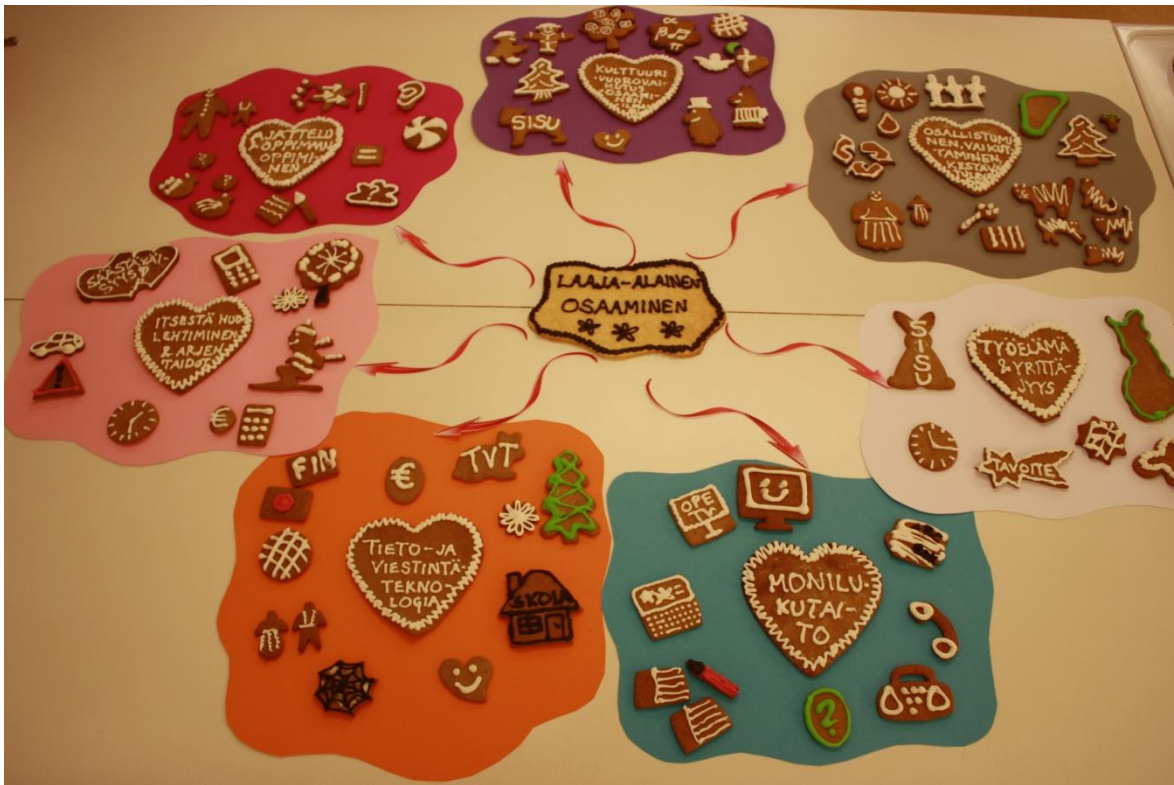
KUVA 11. Laaja-alainen osaaminen osa-alueineen

osa-alueet avataan jokaisen oppiaineen tavoitteiden ja sisältötarkennusten kohdalla. Näistä ilmenevät kunkin oppiaineen vuosiluokkakohtaiset painotukset laaja-alaisen osaamisen osalta. Laaja-alaisen osaamisen tavoitteiden toteutumista tulee myös seurata ja arvioida. Tämä on mahdollista erikseen jokaisen oppiaineen kohdalla. Lisäksi seuranta ja arviointi voidaan liittää esimerkiksi mahdollisiin keväisin toteutettaviin oppilaiden, huoltajien ja opettajien palautekyselyihin.