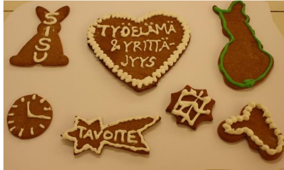
KUVA 9. Työelämätaidot ja yrittäjyys

Työelämätaidot ja yrittäjyys -osa-alueen tavoitteiden toteutumisen mahdollistavat esimerkiksi