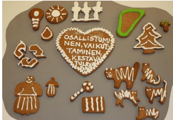
KUVA 10. Osallistuminen, vaikuttaminen ja kestävä tulevaisuuden rakentaminen

Perusopetuksen aikana oppilaat pohtivat menneisyyden, nykyisyyden ja tulevaisuuden välisiä yhteyksiä sekä erilaisia tulevaisuusvaihtoehtoja. Heitä ohjataan ymmärtämään omien valintojen, elämäntapojen ja tekojen merkitys paitsi itselle, myös lähiyhteisöille, yhteiskunnalle ja luonnolle. Oppilaat saavat valmiuksia sekä omien että yhteisön ja yhteiskunnan toimintatapojen ja -rakenteiden arviointiin ja muuttamiseen kestävää tulevaisuutta rakentaviksi.