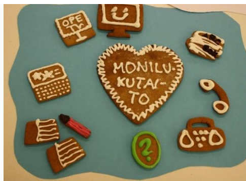
KUVA 7. Monilukutaito

Oppilaiden monilukutaitoa kehitetään kaikissa oppiaineissa arkikielestä kohti eri tiedonalojen kielen ja esitystapojen hallintaa. Osaamisen kehittyminen edellyttää rikasta tekstiympäristöä, sitä hyödyntävää pedagogiikkaa sekä oppiaineiden välistä ja muiden toimijoiden kanssa tehtävää yhteistyötä. Opetus tarjoaa mahdollisuuksia erilaisista teksteistä nauttimiseen. Oppimistilanteissa oppilaat käyttävät, tulkitsevat ja tuottavat erilaisia tekstejä sekä yksin että yhdessä muiden kanssa. Oppimateriaalina hyödynnetään ilmaisultaan monimuotoisia tekstejä ja mahdollistetaan niiden kulttuuristen yhteyksien ymmärtäminen. Opetuksessa tarkastellaan oppilaille merkityksellisiä, autenttisia tekstejä sekä niistä nousevia tulkintoja maailmasta. Näin oppilaat voivat hyödyntää opiskelussa vahvuuksiaan ja itseään kiinnostavia sisältöjä ja käyttää niitä myös osallistumisessa ja vaikuttamisessa.