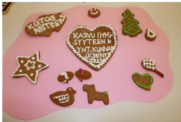
KUVA 1. Ihmisyyteen ja yhteiskunnan jäsenyyteen kasvamiseen liittyviä tekijöitä

Valtioneuvoston asetuksen 2 §:ssä korostetaan koulun kasvatus- ja opetustehtävää. Keskeisenä tavoitteena on tukea oppilaiden kasvua ihmisyyteen ja eettisesti vastuulliseen yhteiskunnan jäsenyyteen. Opetuksen ja kasvatuksen tulee myös tukea kasvua tasapainoisiksi ja terveen itsetunnon omaaviksi ihmisiksi. Asetuksen mukaan opetus edistää kulttuurien sekä aatteellisten, maailmankatsomuksellisten ja uskonnollisten, kuten kristillisten, perinteiden sekä länsimaisen humanismin perinteen tuntemista ja ymmärtämistä. Elämän, toisten ihmisten ja luonnon kunnioittamisen rinnalla korostetaan ihmisarvon loukkaamattomuutta, ihmisoikeuksien kunnioittamista ja suomalaisen yhteiskunnan demokraattisia arvoja, kuten yhdenvertaisuutta ja tasa-arvoa. Sivistykseen nähdään kuuluvaksi myös yhteistyö ja vastuullisuus, terveyden ja hyvinvoinnin edistäminen, kasvu hyviin tapoihin sekä kestävän kehityksen edistäminen.