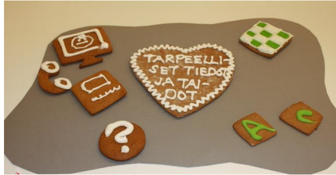
KUVA 2. Tarpeelliset tiedot ja taidot tulevaisuudessa

Asetuksen 3 §:n mukaan opetuksen keskeisenä tavoitteena on luoda perusta oppilaan laajan yleissivistyksen muodostumiselle sekä maailmankuvan avartumiselle. Tähän tarvitaan sekä eri tiedonalojen tietoja ja taitoja että tiedonaloja läpileikkaavaa ja yhdistävää osaamista. Taitojen merkitys korostuu. Asetuksessa todetaan, että opetettavan tiedon tulee perustua tieteelliseen tietoon. Siinä säädetään myös muulla kuin äidinkielellä annettavan opetuksen sekä erityiseen maailmankatsomukseen ja kasvatuserillisiseen järjestelmään perustuvan opetuksen järjestämisestä ja tavoitteista.