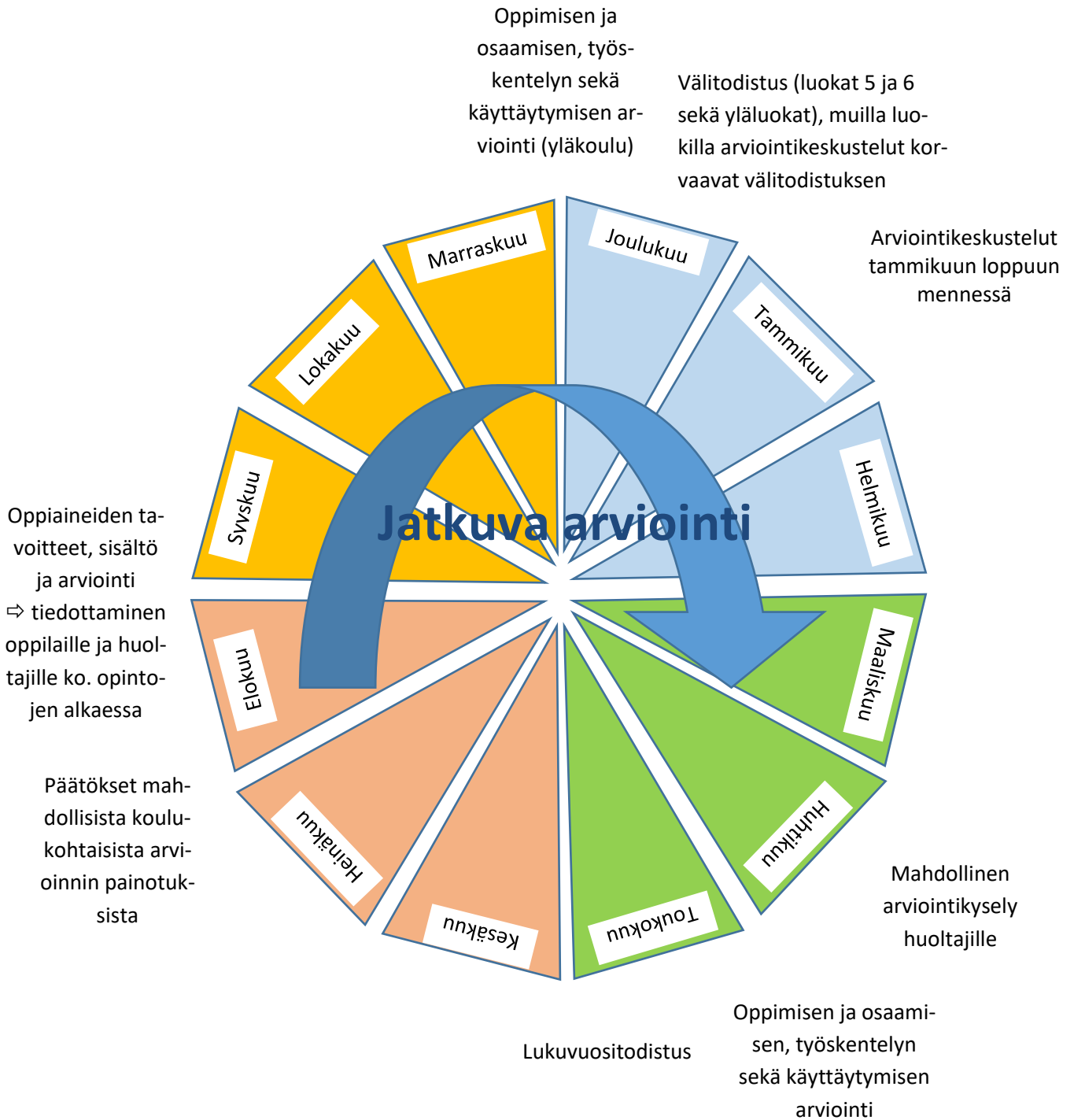
Kuvio 14. Arvioinnin vuosikello Taipalsaarella

Arviointia tapahtuu jatkuvasti läpi kouluvuoden. Jokaiseen kuukauteen voidaan kohdentaa eri arvioinnin osa-alueita ja tehtäviä.